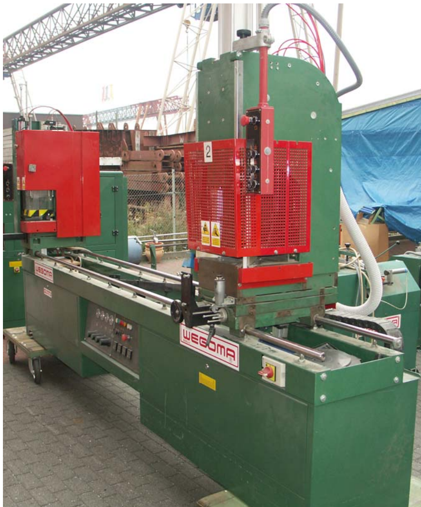
Abb. Maschine im Originalzustand ( nicht überholt)